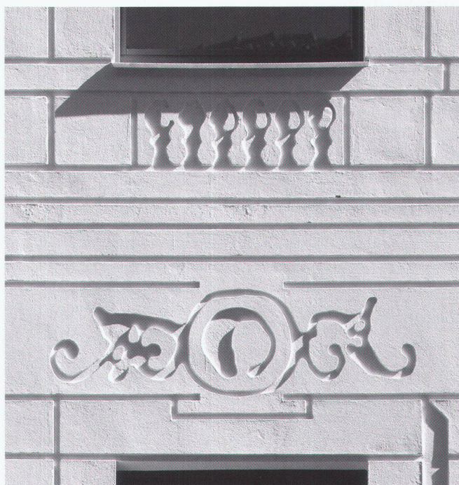
Fassadensanierung in Berlin, 1999

Die stuckierte Fassade des Gründerzeithauses existierte nur noch in Form der Originalzeichnung 1:100. Deren vergrößerte Nachbildung im Relief des neuen Putzes führte zu Verformungen und Verschiebungen, da das Haus nicht deckungsgleich mit der Zeichnung errichtet worden war. Das Ergebnis nimmt eine Position zwischen historischer Rekonstruktion und freier Interpretation ein. So wird die immer vorhandene Abweichung zwischen originalem Entwurf und Bauwerk zum Thema der Erneuerung.