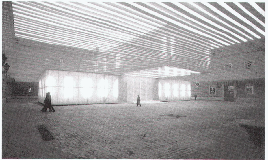
zb architectes, Lausanne: Schweizer Pavillon Madrid, 2003

Conradin Clavuot platziert auf einer Bodenplatte aus Holz einen eingeschossigen hölzernen Pavillon in Strickbauweise, wie er für die Architektur im alpinen Raum typisch ist. Stege führen aus der Bodenplatte hinaus aus dem Hof in den Strassenraum und verbinden so den ruralen