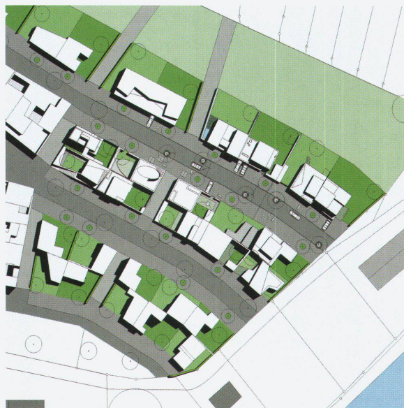
Siedlung Stegbünt: Lageplan

tekten auf der Grundlage des höchst rigiden Masterplans von West8 mitgeknüpft haben.