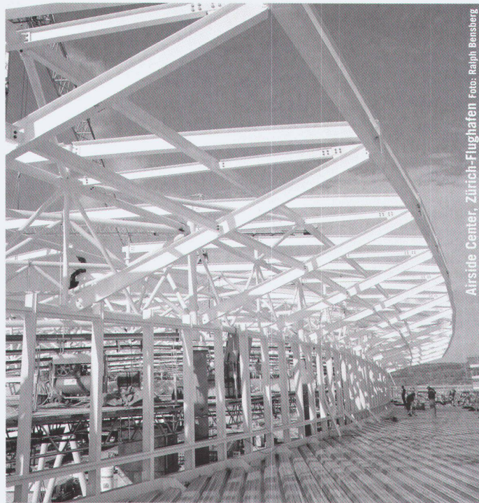
Airside Center, Zürich-Flughafen

Partner für anspruchsvolle Projekte in Stahl und Glas