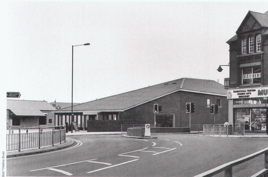
Sergison Bates, Pub im Walsall

Bauherrschaft: Stadtwerke Hall in Tirol GmbH Planung: henke und schrieck Architekten, Wien Baumanagement: BMO Baumanagement, Hall in Tirol Wettbewerb: 2001 Ausführung: Januar 2002 bis Mai 2003