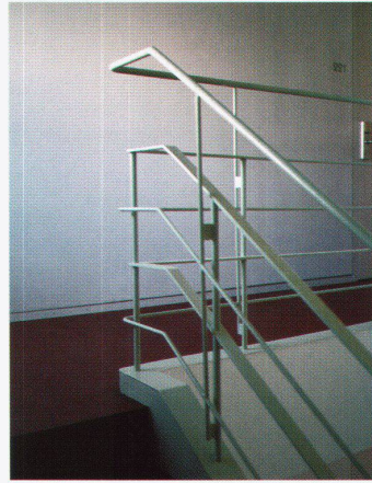
Bilder: © Walter Zschokke

hungsweise im «Spectrum» (13. Oktober 2001), und letzterer schloss mit den Sätzen: «Welzenbachers Turm wird also einen jüngeren Bruder aus Stahl und Glas erhalten, der sich der architektonischen Konkurrenz durch die Auflösung der Tektonik ins Objekthafte geschickt entzieht. 2003, zur 700-Jahrfeier der Stadt Hall, wird man sich, wenn alles läuft wie geplant, davon überzeugen können, ob dieses Konzept aufgegangen ist.» Und da sind wir jetzt zeitlich angelangt.