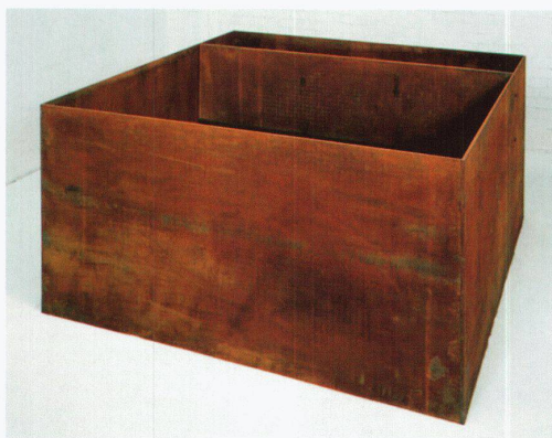
Donald Judd, Ohne Titel (DJ 89-3), 1989. – Bild: Waddington Galleries, London

Naturwissenschaften gehen von einer «Wahrheit» aus, die auf reiner – d. h. vom Menschen und seiner Unvollständigkeit unabhängiger – Logik beruht, die «gelesen» und «erkannt» werden muss. Die Gesetze dieser Wahrheit werden als vorgegeben begriffen, werden aber in Wirklichkeit oft erst durch die Forschungsmethode und im Labor hergestellt. Eine solche Vorstellung von «Reinheit» der Wissenschaft, die Berechenbarkeit und «Lesbarkeit» impliziert, ist ein Spezifikum des abendländischen Denkens, hinter dem nicht nur ein Universalitätsanspruch, sondern auch eine Definitionsmacht über das «Wahre» und «Wirkliche» steht. Das heisst, hinter der Behauptung einer «Reinheit der Wissenschaft» scheint ein Ideal der Vereinheitlichung auf, bei der die Reinheit zur Einheit aller Individuen führen soll.