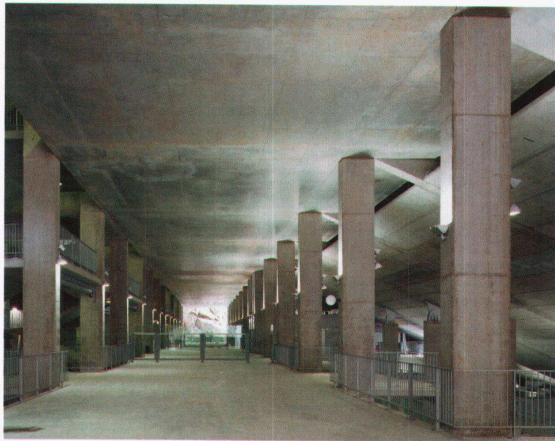
Unter der Tribüne