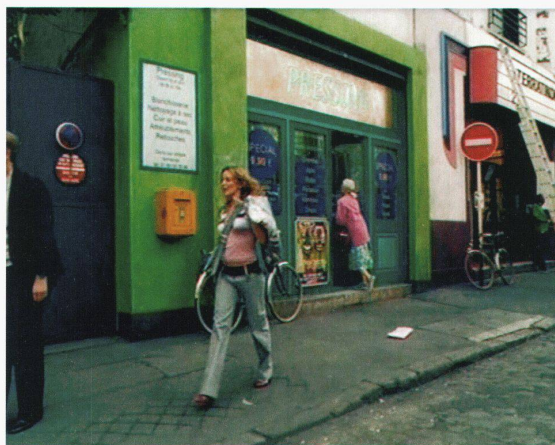
Videostills aus Kylie Minogues «Come Into My world»