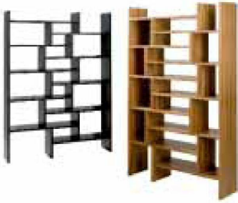
«Duo» Schieberegal von Beat Karrer