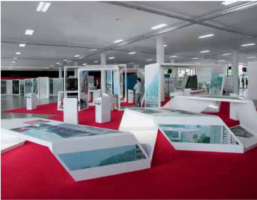
Bilder: HHF architects