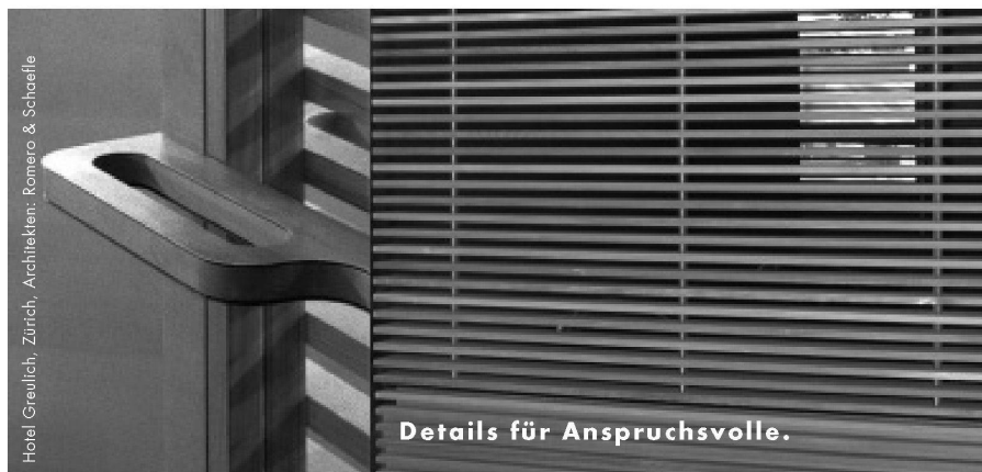
Hotel Greulich, Zürich, Architekten: Romero & Schaeffle

Die beiden übernahmen den Auftrag parallel zu ihrem Masterstudium und machten sich in einer intensiven Recherche kundig über die Geschichte englischer Pubs. Dabei entdeckten sie,