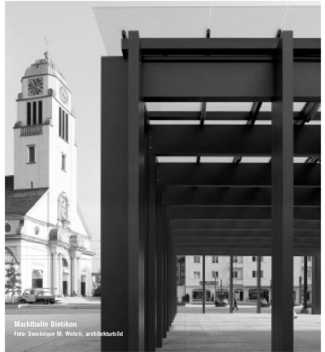
Markthalle Dietikon

Prädikat «Gute Form» ausgezeichnet, ist der bequeme wie robuste Liegestuhl heute ein Klassiker im Bereich der Gartenmöbel. Der Stuhl wird seit 1971 durch die Embru-Werke vertrieben und kann im gehobenen Designmöbel-Fachhandel bezogen werden. Das feuerverzinkte Rohrgestell wird in der Luzerner Stiftung Brändi mit den Kunststoff-Kordeln bespannt und ist in den Farben Gelb, Grün, Hellblau, Weiss, Schwarz und Rot erhältlich. Embru-Werke, Mantel & Cie CH-8630 Rüti www.embru.ch