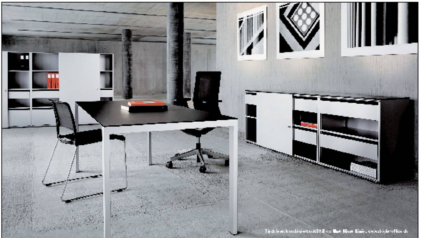
Tisch kann kombiniert mit Box, Mat, Tisch, www.biglaoffice.ch

Tuchs Schmid AG CH-8501 Frauenfeld Telefon +41 52 728 81 11 www.tuchschmid.ch