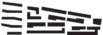
burkhalter sumi architekten, Zürich

Die Ergebnisse der Testplanung und des Gestaltungsplans wurden im April 2008 der Bevölkerung vorgestellt. Mit einer nun laufenden Anpassung der Bau- und Zonenordnung wollen Stadt und Eigentümerinnen das Areal Lagerplatz aus der Industriezone I 2 und der Zentrumszone Z 7 in eine neu geschaffene Zentrumszone Z 5 überführen. Auf der Grundlage des Gestaltungsplans werden die Verkaufsgespräche der Eigentümerinnen mit der Stiftung Abendrot und anderen Kaufinteressenten weitergeführt.