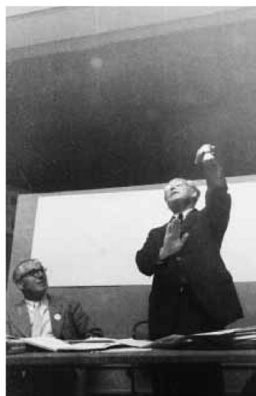
Sigfried Giedion am CIAM-Kongress in Bridgwater 1947.