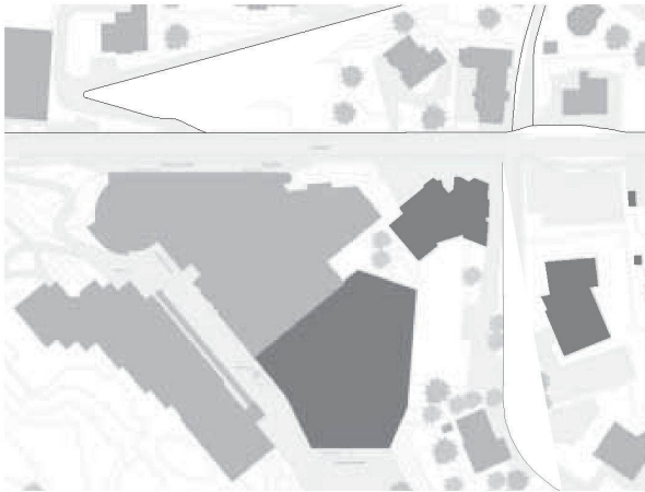
2. Rang Gigon/Guyer Architekten, Zürich