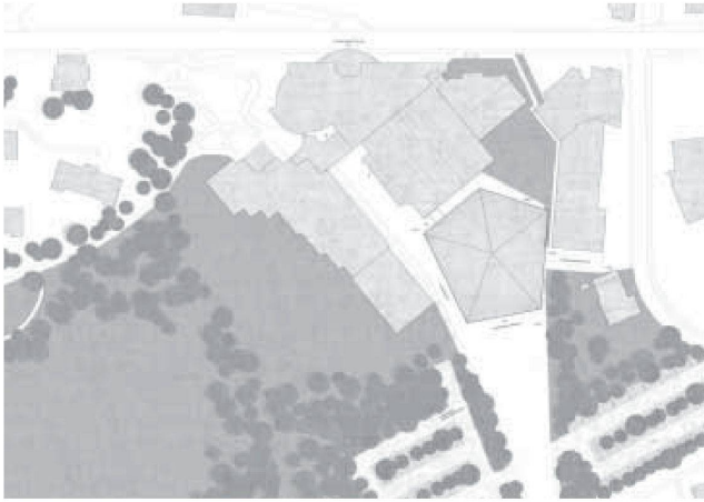
4. Rang Bearth & Deplazes Architekten, Chur