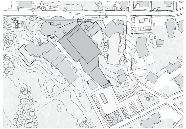
5. Rang Meili Peter Architekten, Zürich

Das siegreiche Projekt von Degelo Architekten überzeugt in der räumlichen Organisation, auch in Bezug zum Bestand und agiert mit der Ausrichtung auf die Talstrasse städtebaulich visionär. Einen ähnlich sorgfältigen Umgang wünschte man sich im Zuge der Ausarbeitung zum Bauprojekt, das 2009–2010 realisiert werden soll, noch hinsichtlich des Bezuges zur Landschaft, einem der wichtigsten Standortfaktoren von Davos.