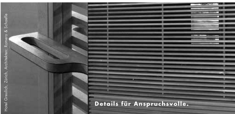
Hotel Greulich, Zürich, Architekten: Romero & Schaeffle

Im Vergleich dazu machen sich andere Teilnehmer dieses spezifische Potenzial zunutze und reagieren mit ihrer Architektur auf die unmittelbare Präsenz der Landschaft. Meili Peter etwa lassen sie auch im Innern jederzeit allgegenwärtig, dirigieren in ihrem Projekt mit gebrochenen Geometrien die Blicke nach aussen, schaffen sich immer wieder ändernde Landschaftsansichten, eigentliche Veduten; Morger + Dettli fokussieren den Ausblick gezielt mit einer Serie konischer Räume; Stauer & Hasler schliesslich inszenieren in ihrem «Raum-Schiff» den Landschaftsbezug in der Wegführung durch das Gebäude, die in der Gestaltung des Saales respektive seiner Vorbereiche am Endpunkt des Weges als in den Landschaftsraum hineinragende Brücke kulminiert.