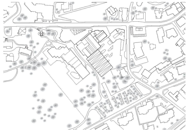
3. Rang Morger & Dettli Architekten, Basel

Holz zwar eine homogene Erscheinung, die sich auch an Bauten in der näheren Umgebung wie dem Sportzentrum oder dem Werkhof von Gigon/Guyer anlehnt, lässt das Gebäude trotz seiner Ausdehnung aber auch als leicht, hoffentlich jedoch nicht als zu leichtgewichtig erscheinen.