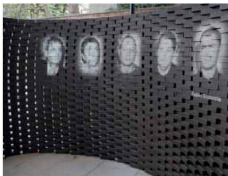
Auf die Ziegelwand von Gramazio & Kohler projizierte Videosequenzen mit Portraits und Statements der am Schweizer Beitrag beteiligten Professoren

ob Architektur nur in übertragener Sprache und Bildern simuliert, fragmentarisch als künstlerische Beilage aufbereitet werden soll oder ob sie als Frucht und Anverwandlung bewährter Baukultur gepflegt wird. Wer jenseits des Bauens etwas ausrichten will, muss wissen, was vom Bauen vorweg diesseits erwartet wird. Deshalb ist die Ausbildung junger Leute zu Architektinnen und Architekten gleichzeitig diesseits und jenseits des Bauens anzusiedeln, nämlich dort wo Grundlagen vermittelt werden, Knochenarbeit geleistet wird und zugleich Kreativität entspringen mag.