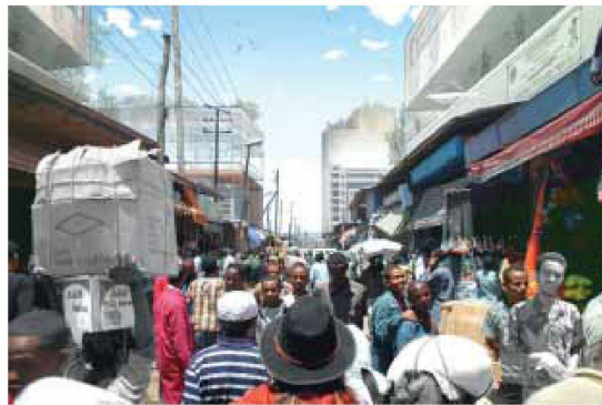
Networks – Mercato Addis Abeba, Professur MAS UD, Marc Angélil ETHZ

Rolle. Der «Réalités parallèles» bezeichnete Lehransatz beinhaltet u. a. die gleichzeitige oder parallele Anwendung unterschiedlicher Werkzeuge, wie Modelle, Bilder, 3-D-Software, CAD usw. Das «Herstellen» im virtuellen wie im physischen Sinn spielt eine wesentliche Rolle. Wenige ausgestellte Modell-Objekte, knallig rote Farbflächen und ein Film zum in London realisierten Studienprojekt «Overflow» – einer aus mehr als 800 einzelnen Teilen gefügten netzartigen Struktur aus Styropor – die auf die Gezeiten der Themse reagiert, veranschaulichen den Ansatz, die Studenten in ihren Arbeiten möglichst an den Massstab 1:1 heranzuführen.