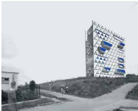
Methodology – Projekt für einen Wasserturm in Havanna, Professur LAPA, Harry Gugger EPFL