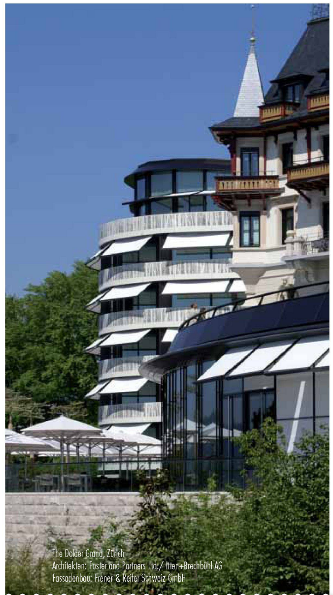
The Dolder Grand, Zürich Architekten: Foster and Partners Ltd./Itten+Brechbühl AG Fassadenbau: Frener & Reifer Schweiz GmbH

Zürich, Museum Bellerive Eidgenössische Förderpreise für Design 2008 bis 1.2. www.museum-gestaltung.ch