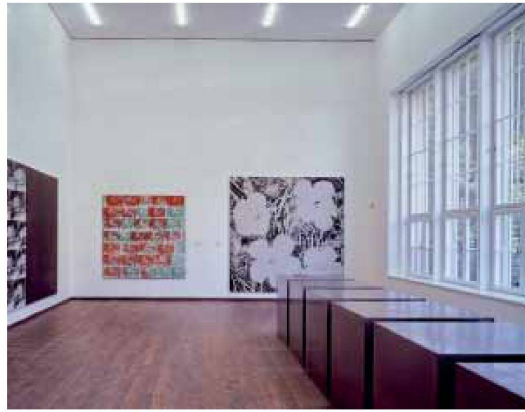
Ausstellung in der ehemaligen Bibliothek

so raffiniert in ein traditionell detailliertes Interieur integriert, dass am Ende das faszinierend unsichtbare Projekt nur mit detektivischer Akribie dechiffrierbar wird.