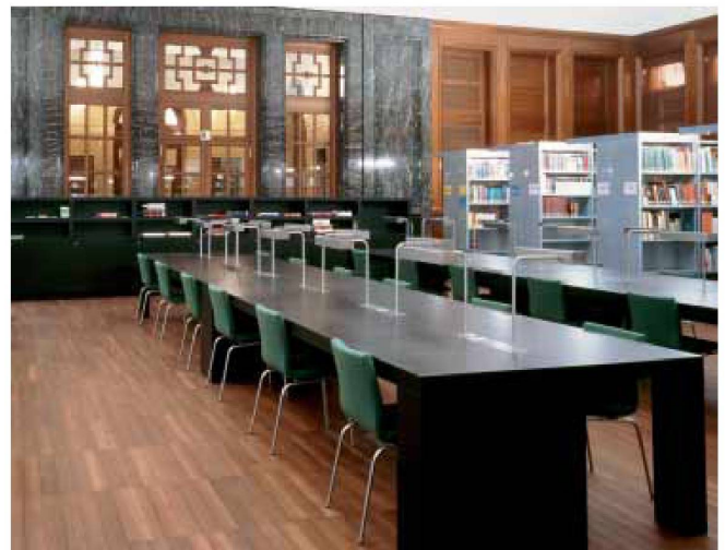
Neue Bibliothek im Laurenzbau

Bauherrschaft: Baudepartement des Kantons Basel Stadt, Hochbau- und Planungsamt, Hauptabteilung Hochbau Architektur: Annette Gigon / Mike Guyer, Architekten, Zürich; Mitarbeit: Christian Maggioni (Projektleitung), Thomas Hochstrasser (Bauleitung), Florian Isler Stühle Lesesaal, Möbel Bistro: Hannes Wettstein und Gigon/Guyer Ausführung: Wettbewerbf 2001 (Umbau und Erweiterung), Planungsbeginn ohne Erweiterung 2003, Umbau ausgeführt in drei Etappen 2004–2007