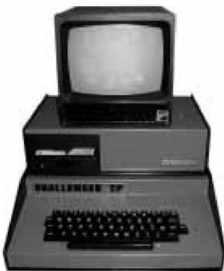
Ohio Scientific 2P Computer, 1979.

Diesen beiden Spielarten entsprechen zwei Dimensionen des Archaischen, die sich immer wieder unterscheiden lassen. So ist es einerseits das Einfache, Elementare, noch Unentwickelte, kann andererseits aber genauso durch Unklarheit und mangelnde Elaboreiertheit auffallen. Im einen Fall ist das Archaische anfänglich im Sinne von schlicht; es bietet sich als Grundlage für weitere Entwicklungen an, ist die Basis für Kom-