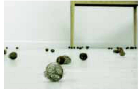
Mona Hatoum, Recollection, 1995, Museum van Hedendaagse Kunst Antwerpen

wollten, ist das Archaische nichts, was lediglich in eine Frühzeit der Kultur gehört, ja was Schritt um Schritt – endgültig – überwunden werden könnte. Im Gegenteil fällt auf, dass gerade Epochen, in denen vieles etabliert und daher elaboriert ist, auch besondere Bedürfnisse nach Archaischem entwickeln. Hätte Nietzsche darin noch eine Variante des dionysischen Triebs erkannt, der sich allen apollinischen Sublimierungen widersetzt, so würde man heute wohl eher vermuten, dass Archaisches eine Überzivilisierung kompensieren soll und als Verheißung in einer Welt auftritt, die in vielen Bereichen als ausbuchstabiert und reglementiert, eben deshalb aber auch als entfremdet empfunden wird.