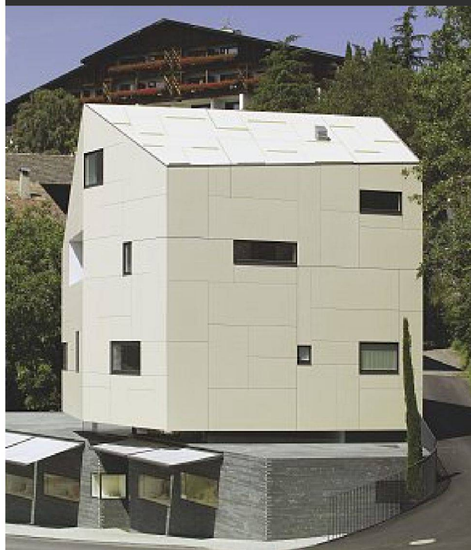
Architekten: Hölmler & Klotzner, I-39012 Meran Dach: INTEGRAL CREA Fassade: SWISSPEARL