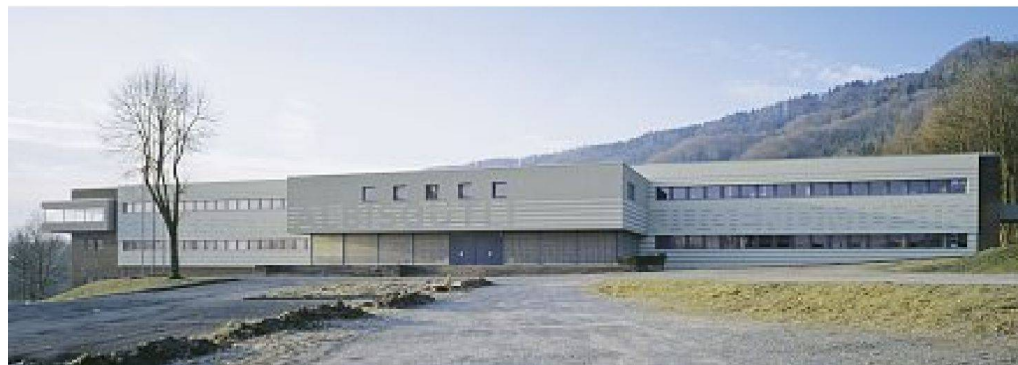
Nordfassade mit dem Schriftzug in Form eines kommunikativen Ornaments (links oben), offene Südfront zu den Zielscheiben (links unten), neuer Musiksaal im OG (rechts oben) und Schiessstand im EG (rechts unten)