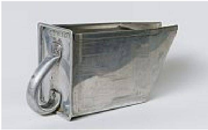
Gebrauchte Aluschütte: Was sagen Kratzer, Beulen und Verfärbungen?

erscheinungen oder vermeintlichen Schadensphänomenen steckt oft eine bedeutungsträchtige Ästhetik, die dem Material oder dem Objekt im «Originalzustand» nicht nachsteht. So hat sich beispielsweise das Korrosionsprodukt von Eisen, Rost, heute längst als ästhetischer Oberflächeneffekt in Designprozessen etabliert. 6