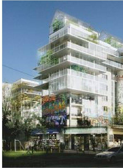
Aufwertung desolater Wohnblöcke zu vertikalen «Eco-Quartiers», ebenfalls von Jean Nouvel

«Morphogenetische Perspektiven – Die Stadt als lebendiger Organismus» zeigte die Konzeption der Stadt als ein organisches, sich ständig veränderndes Gebilde. Jenseits von Massstäblichkeit kontrollieren die «Bio-Tech-Systeme» jedes dynamische Wachstum und generieren ein eigenes, im bisherigen Städtebau unbekanntes Vokabular. Zum Abschluss beleuchtete das Thema «Grenzen des generierten Chaos» hybride Stadterweiterungen, die zusehends unkontrollierbare Systeme generieren. Während sich Kengo Kuma für eine Wiederkehr natürlicher Baumaterialien einsetzt, sieht Thom Mayne (Morphosis) in der Technologie den wahren Fortschritt. Rem Koolhaas kritisierte heftig Frankreichs Politik, den Vorstadtproblemen und Potenzialen den Rücken zu kehren, anstatt sich mit dem Erbe der Moderne intensiv auseinander zu setzen. Er kündigte an, dass er sich nach jahrzehntelanger Beschäftigung mit der Stadt