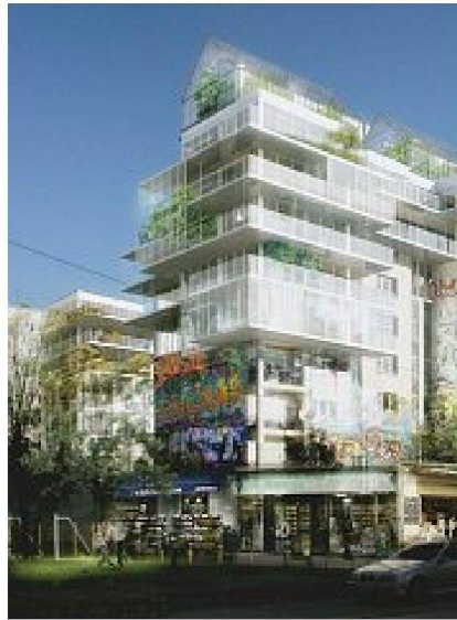
Aufwertung desolater Wohnblöcke zu vertikalen «Eco-Quartiers», ebenfalls von Jean Nouvel

«Morphogenetische Perspektiven – Die Stadt als lebendiger Organismus» zeigte die Konzeption der Stadt als ein organisches, sich ständig veränderndes Gebilde. Jenseits von Massstäblichkeit kontrollieren die «Bio-Tech-Systeme» jedes dynamische Wachstum und generieren ein eigenes, im bisherigen Städtebau unbekanntes Vokabular. Zum Abschluss beleuchtete das Thema «Grenzen des generierten Chaos» hybride Stadterweiterungen, die zusehends unkontrollierbare Systeme generieren. Während sich Kengo Kuma für eine Wiederkehr natürlicher Baumaterialien einsetzt, sieht Thom Mayne (Morphosis) in der Technologie den wahren Fortschritt. Rem Koolhaas kritisierte heftig Frankreichs Politik, den Vorstadtproblemen und Potenzialen den Rücken zu kehren, anstatt sich mit dem Erbe der Moderne intensiv auseinander zu setzen. Er kündigte an, dass er sich nach jahrzehntelanger Beschäftigung mit der Stadt