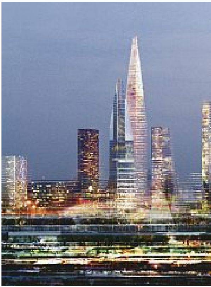
Bilder: Ateliers Jean Nouvel

Verdichtung des gebauten Bestandes von Jean Nouvel, hier im Quartier Genevilliers.