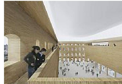
Sonderpreis: Kuehn Malvezzi, Berlin. Rechtes Bild: Humboldt-Forum