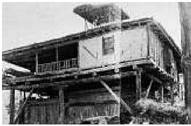
Le Corbusier entdeckt mit den Pilotis eine Urform der Architektur, die auf den Pfahlbau zurückreicht. Foto einer Fischerhütte in der Türkei und LCs Zeichnung der Villa Savoye. Gegenüberstellung von Max Vogt. Bild aus: Max Vogt, Le Corbusier – der edle Wilde, Braunschweig 1996.

«Nur durch dauernde Berührung mit der fortschreitenden Technik, mit der Erfindung neuer Materialien und neuer Konstruktionen gewinnt das gestaltende Individuum die Fähigkeit, die Gegenstände in lebendige Beziehung zur Überlieferung zu bringen.» Wie er anfügt, sei aus dieser neuen Beziehung zur Vergangenheit wiederum für die Gegenwartspraxis die «neue Werkgesinnung» zu entwickeln.