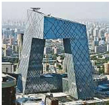
Oben: Porsche Museum in Stuttgart, Delugan Meissl Associated Architects, 2005–2008. Unten: CCTV-Tower, OMA, Rem Koolhaas und Ole Scheeren, 2002–2010.

dynamisch sich verändernden Gegenwart die innovative Architekturpraxis sich zur Geschichte verhält.