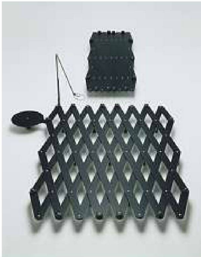
Scherenbett Mod. Nr. 990, Kurt Thut 1990