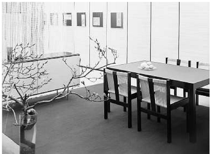
Eröffnungsschaufenster im neuen Ausstellungspavillon bei teo jakob, Bern 1956

Bilder: Museum für Gestaltung Zürich, Designsammlung; Alfred Hölzlel; © Schweizerische Eidgenossenschaft, Bundesamt für Kultur, Bern