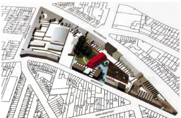
Projekte für Sozialwohnungsbau und Aufwertung des Quartiers Brugse Poort, Open Oproep (von oben nach unten): Luizengevecht von Puls_net cvba, Acaciapark von Abscis Architecten und Biezenstuk von Architectenbureau Patrick