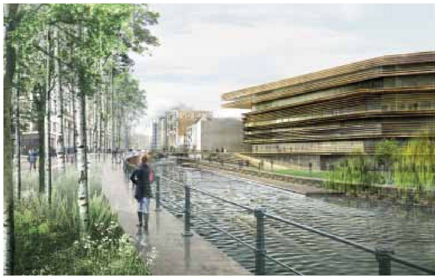
Open Oproep: Mediathek «De Waalse Krook», Gent, Coussée & Goris Architekten mit RCR Aranda Pigem Vilalta Arquitectes, Wettbewerb 2009, Realisierung voraussichtlich ab 2012

fläche über 10 000 m 2 geht über unseren Tisch und wir nehmen dazu Stellung. Unser Rat ist aber nicht bindend. Hinzu kommen alle Bauvorhaben, die ganz oder teilweise mit öffentlichen Beiträgen finanziert werden. Wir sehen also eine ganze Menge Projekte.