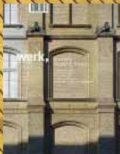
3|11 et cetera Diener & Diener