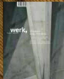
11|10 et cetera Livio Vacchini