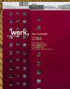
10|10 Die Vorstadt