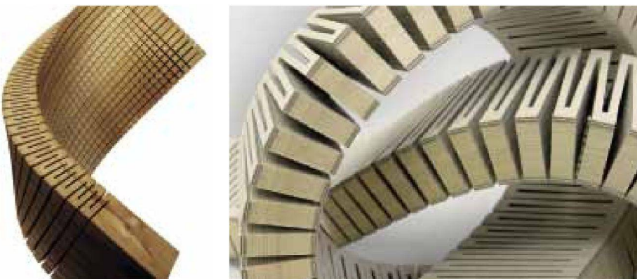
Längs und quer eingefräste Einschnitte im Massivholz (links); Holzplatten mit einfach gefrästen Einschnitten (rechts)

Zu den Fragen gesellte sich auch eine Entdeckung: Mit dem «dukta»-Verfahren eingeschnittenes Holz verfügt über schalldämpfende Eigenschaften. Diese Qualität verfolgen die beiden Tüftler nun zweigleisig weiter. Einerseits sind sie mit der Schreinerei Schneider in Pratteln daran, ein standardisiertes Akustikpaneel zu entwickeln, welches einfach herzustellen und zu montieren ist. Ziel dieser Zusammenarbeit ist, ein modulares Serienprodukt für den Innenausbau zu generieren. Andererseits bietet «dukta» auch die Möglichkeit,