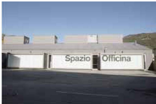
Architektur im Film-Bild: Steg am Zürcher Obersee von Reto Zindel und Kulturinsel in Chiasso von Durisch Noll

leiter, Designstudenten und Kinotheaterbetreiber. Vermittelt wird die Architektur in erster Linie durch das Reden über die Bauten. Die Vergangenheit aufleben lässt die Geschichte des kunsthistorisch wertvollen Kinos aus den dreissiger Jahren, die Gegenwart bringen Impressionen aus vollen Konzertsälen näher.