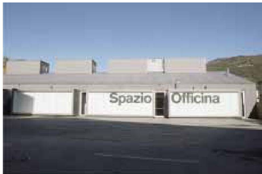
Architektur im Film-Bild: Steg am Zürcher Obersee von Reto Zindel und Kulturinsel in Chiasso von Durisch Noll

leiter, Designstudenten und Kinotheaterbetreiber. Vermittelt wird die Architektur in erster Linie durch das Reden über die Bauten. Die Vergangenheit aufleben lässt die Geschichte des kunsthistorisch wertvollen Kinos aus den dreissiger Jahren, die Gegenwart bringen Impressionen aus vollen Konzertsälen näher.