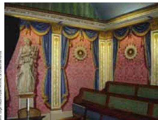
Freimaurerloge «L'Amitié» in La Chaux-de-Fonds