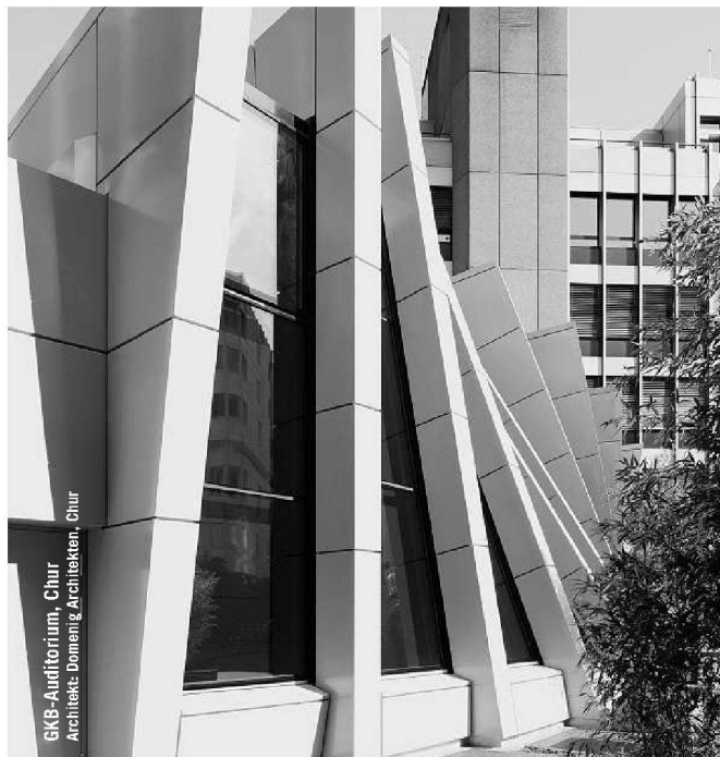
GKB-Auditorium, Chur Architekt: Domenig Architekten, Chur