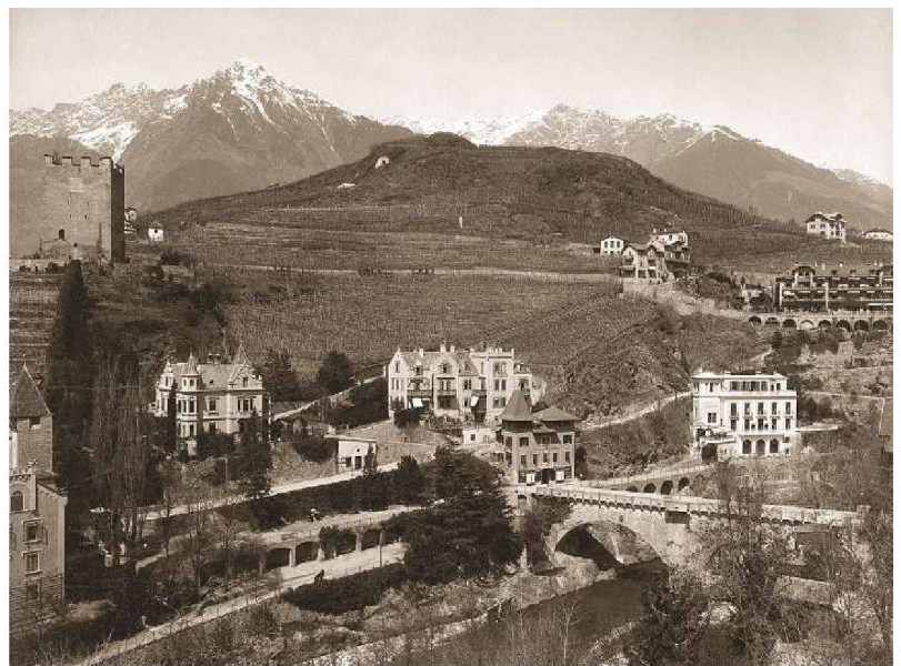
Villenbebauung ausserhalb des Passeirertors seit den 1870er Jahren

Weniger der Wettbewerb der Stile und noch weniger die Genialität einzelner Baukünstler brachten den Ort weiter als das von Pixner Pertoll beschrie-