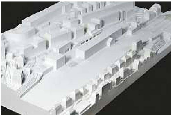
1. Rang Estudio Barozzi Veiga, Barcelona

Bei einer ersten Betrachtung der eingereichten Entwürfe zeigen sich zwei grundlegende Projektansätze, die sich weniger wegen ihrer Form unterscheiden lassen, als in der Art, wie sie Stadt und Areal lesen und interpretieren. Einerseits finden sich Vorschläge, die sich als Solitäre in die bestehenden Leerräume der Umgebung einschreiben und so eine Dialektik zwischen Volumen und Leerraum erreichen. Diese Dialektik setzt sich