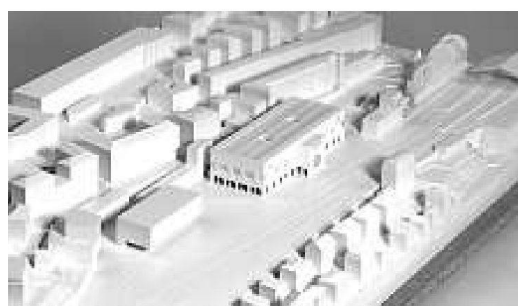
Von oben nach unten: 2. Rang Caruso St John Architects, London; 4. Rang EM2N, Zürich; 5. Rang Annette Gigon / Mike Guyer, Zürich; 6. Rang Jessen + Vollenweider, Basel; 7. Rang Durisch & Noll, Lugano Massagno

ker und Architekt Cache beschreibt Lausanne in seinem Aufbau nicht als logische Konsequenz von Geschichte und Ort, sondern vielmehr als eine Serie von bewusst interpretierenden, manchmal visionären Akten, basierend jeweils auf einer sorgfältigen Lektüre der Topografie und der Stadt, die sie jedes Mal anders und wieder neu entstehen liess. Seinerseits verwendet Cache nicht das bekannte Vokabular der Städtebauer, Architekten und Historiker, sondern leitet eine Serie von geometrischen Figuren her, die er mit mathematischen Modellen ergänzt. Die Identität eines Ortes – schreibt Cache – existiere nicht von sich aus, sie sei immer konstruiert. Der Schnitt des Eisenbahntrassees in die Topografie zwischen Ouchy und Bourg, dort wo das neue MCBA entstehen soll, stellt genau eine dieser Neuartikulationen der Stadt Lausanne dar.