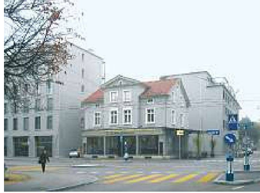
2006, kurz vor Abbruch