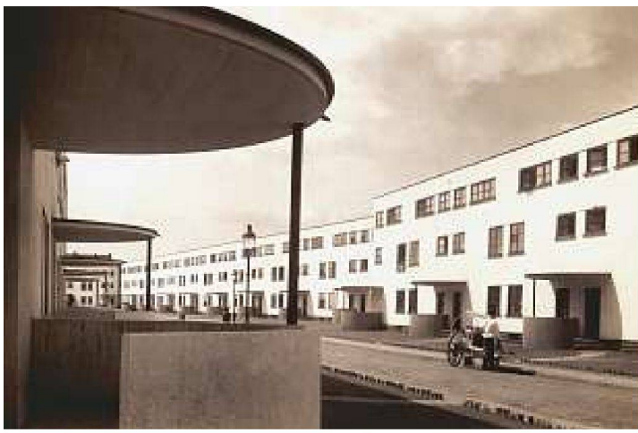
Siedlung Bruchfeldstrasse in Frankfurt, 1927