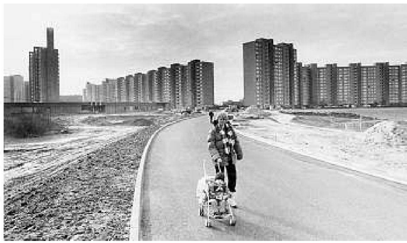
Siedlung Darmstadt-Kranichstein, 1965-1970