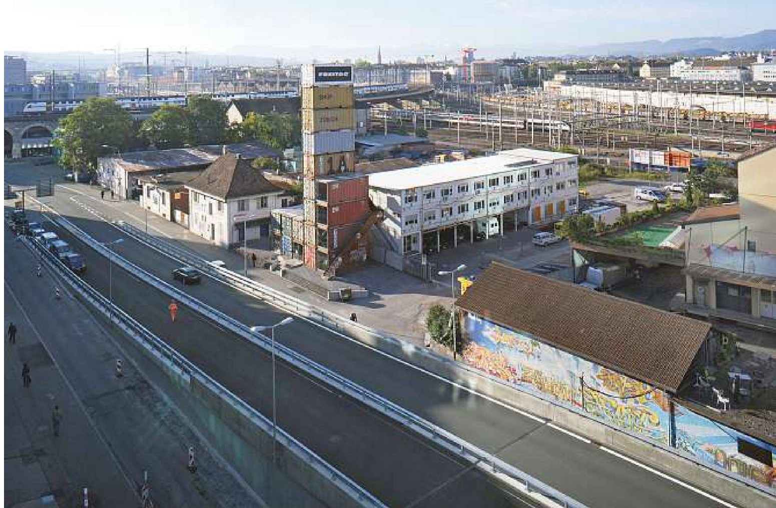
Das Gebiet an der Geroldstrasse mit Blick nach Süden.