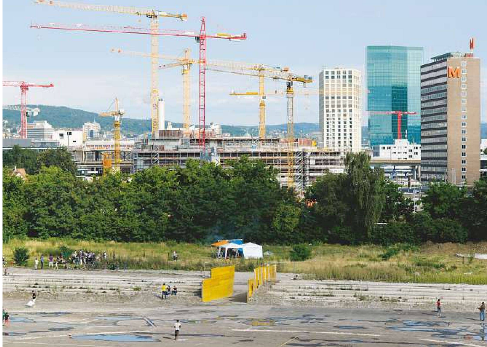
Stadionbrache am Tag der Eröffnung 10. Juli 2011.

cadres réglementées. Il semblerait qu'une forme hyper dynamique d'informel se soit adaptée et développée à Zurich et qu'elle tire aujourd'hui profit des processus plus lents d'une démocratie se développant à partir de la base ainsi que des procédures politiques ambiguës qui déterminent si souvent le contexte d'un changement à l'intérieur de la ville.