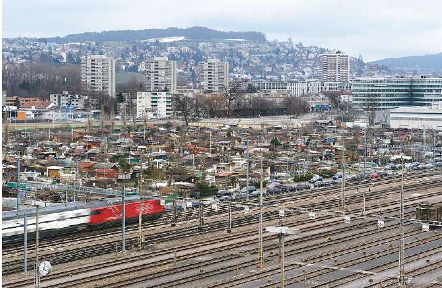
Schrebergarten-Areal in Zürich-Altstetten.