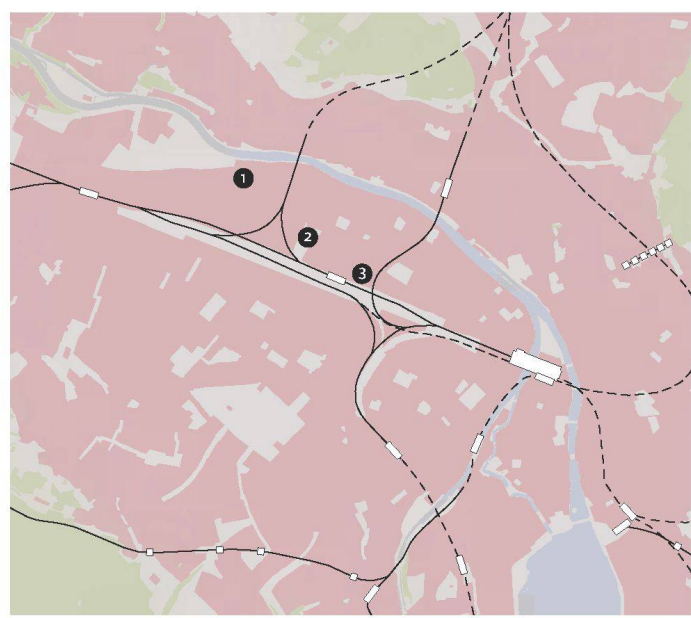
1 Areal Geroldstrasse, 2 Schrebergärten Pfingstweidstrasse, 3 Stadionbrache Hardturm