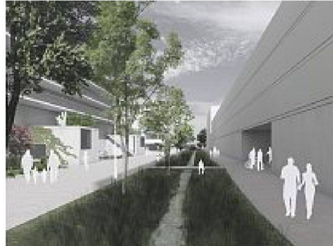
1. Preis, Projekt «ZIP» von tribu'architecture

Unterteilung des neuen Quartiers in offene Baufelder. Die urbane Form und die Baumasse der Gebäude werden in Abhängigkeit von der Straßenbreite bestimmt, um sowohl die Besonnung der Südfassaden zu gewährleisten als auch die Dichte der Volumen bis an die Peripherie des Standortes abnehmen zu lassen.