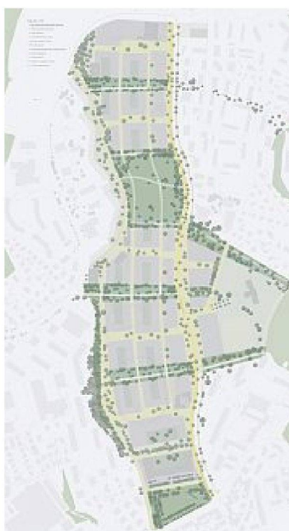
5. Preis: Studio d'architecture Jean-Daniel Paschoud