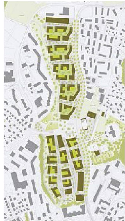
2. Preis: 2b architectes