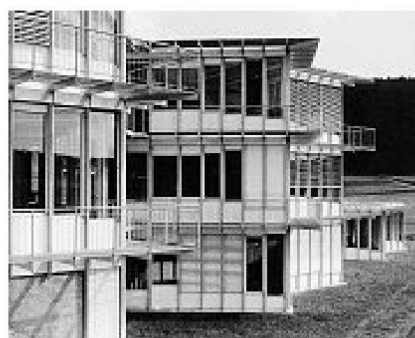
Überregionales Fortbildungszentrum in Tramelan (1982–91)

in räumliche und baukörperliche Qualität umgesetzt. Dieser bedeutende öffentliche Bau wird zusammen mit anderen hoffentlich lange und zu einem anerkennenden Publikum von den Fähigkeiten dieser beiden Architekten reden.