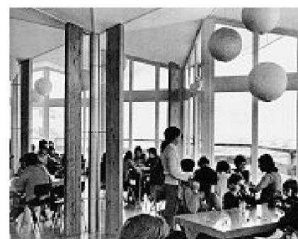
Kinderdorf Leuk (1967–72)