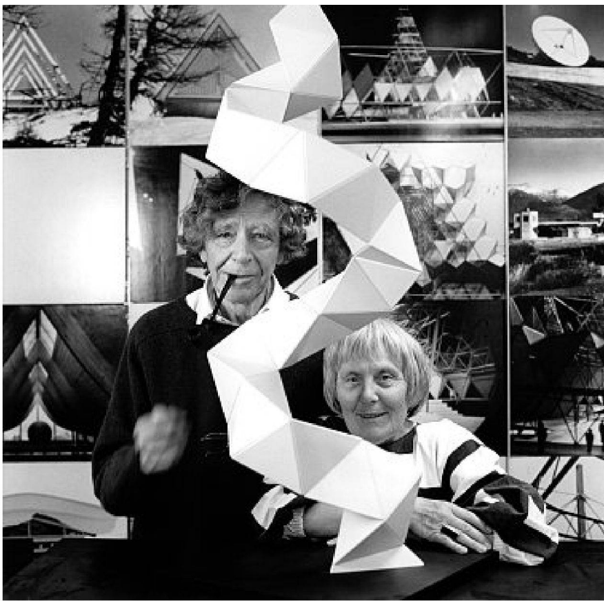
Bild aus: Heidi + Peter Wenger – Architekten / Architects, Visp 2010; Foto Robert Hofer