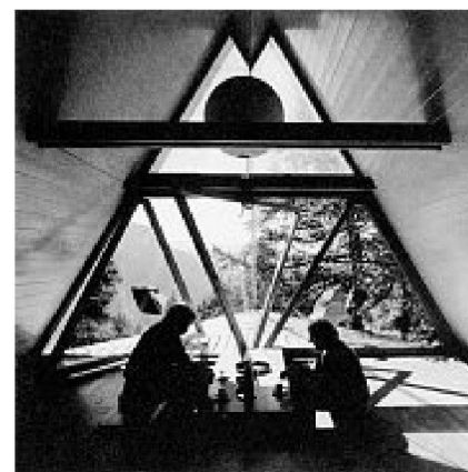
Trigon Ferienhaus in Safisch (1956)