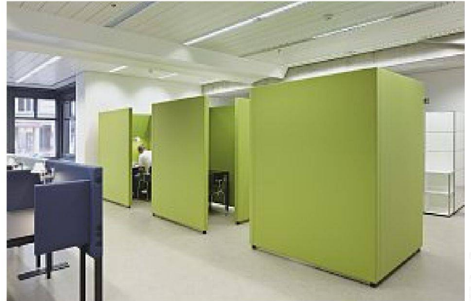
Bilder: Gasser Derungs