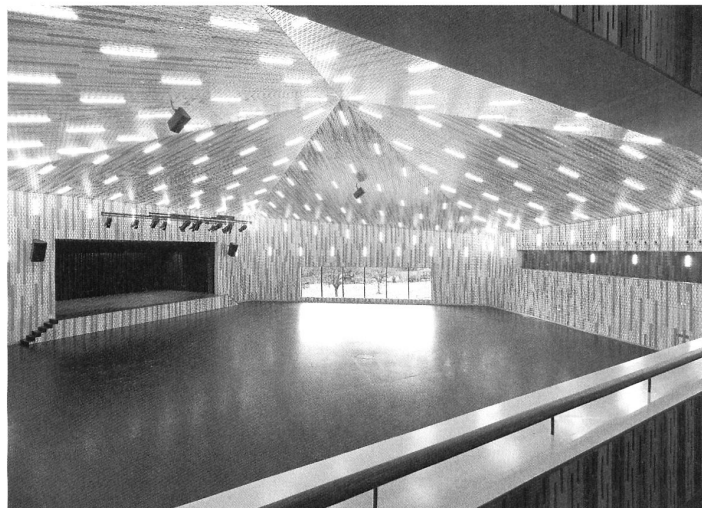
Der festliche Innenraum des Pentoramas in Amriswil.