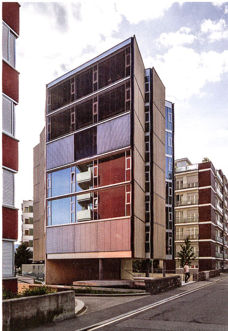
Der freie Stadtraum der brasilianischen Moderne: Das Wohnhaus Casa Pico in Lugano. → S. 76