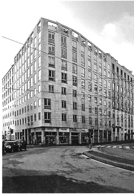
Modulation der Fensterformate: Links das Mobimo-Hochhaus in Zürich-West von Diener & Diener 2011, rechts Via Albricci in Mailand von Asnago und Vender 1958.

Kontext der Stadt zu verankern. So erscheinen die Türme an der Europaallee, das Kontrollzentrum Kohlendreick und das hohe Haus in Wiedikon nicht als aggressive Gegenwartsarchitektur im städtischen Raum, sondern als mehr oder weniger grosse «Häuser des Menschen». Darum geht es auch in den Wohngebäuden in Zürich West von Meili, Peter. Dank der Facettierung der Fassaden werden die grossen Volumina in kleine Balkontrakte unterteilt, an denen sich die Individualität der Bewohner ablesen lässt. Diese Haltung und der formale Wille finden sich ebenso in den Wohnhäusern an der via Quadronno von Angelo Mangiarotti und Bruno Morassutti oder an der Via Vigoni von Luigi Caccia Dominioni.