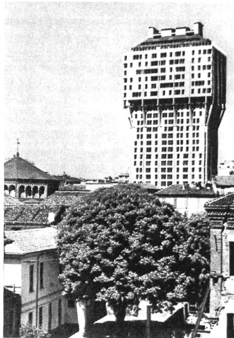
Hochhaus mit Schrägdach: Links Wohnhäuser an der Europaallee in Zürich von Caruso St John 2014, rechts die Torre Velasca in Mailand 1958. Bild links: Giulio Bettini, Bild rechts aus: Ernesto Rogers, Esperienza dell'architettura , Mailand 1997

Auch die Art, wie die mailändischen Erfahrungen verarbeitet werden, ist interessant. Wie die Beispiele zeigen, geht es nicht um einen rein formalen Prozess. Die Mailänder Architektur der Nachkriegszeit hat keinen zweidimensionalen Stil geschaffen, sondern eine neue Art städtischer Realität. Es ging damals nicht um Oberfläche, sondern um die Neudefinition von archetypischen architektonischen Themen, die im kollektiven Gedächtnis verwurzelt sind (das Schrägdach, die Dachrinne, die Fensterproportionen). An dieser damals neu geschöpften Realität knüpfen die Architekten an der Limmat an und entwickeln sie weiter, um eine neue städtische Architektur für Zürich zu realisieren. Und weil es um Realität und nicht um Form geht (vergessen wir die Mahnung von Rogers nicht!), wird die Architektur in Zürich anders als in Mailand ausgebildet. Die Fenster von Patrick Gmür, Diener und Diener und Loeliger Strub erinnern an die mailändischen Modelle, sind aber keine blossen Kopien davon. Diese Art Neubearbeitung kann besser durch einige Werke von zwei Gegenwartskünstlern verstanden werden. Fischli/Weiss beschäftigten sich in ihren Arbeiten aus Polyurethan