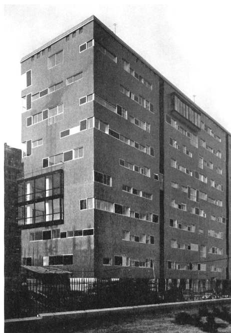
Modulation der Öffnungen: Das Hochhaus Hardturmpark in Zürich von Gmür & Geschwentner Architekten, Zürich 2013 und das Wohnhaus Via Nievo in Mailand von Luigi Caccia Dominioni 1957. Bild links: Giulio Bettini, rechts aus: Roberto Aloj, Nuove architetture a Milano , 1959

ten Schrägdach der Attika: elf Geschosse mit Schrägdach, und das nicht in jenem ländlich anmutenden, vernakulären Stil, wie ihn die Schweiz seit den 1940er Jahren kennt. Das gleiche Merkmal wiederholt sich an den Türmen der Europaallee von Caruso St John oder im Kontrollzentrum der SBB am Kohlendreieck von von Ballmoos Krucker.