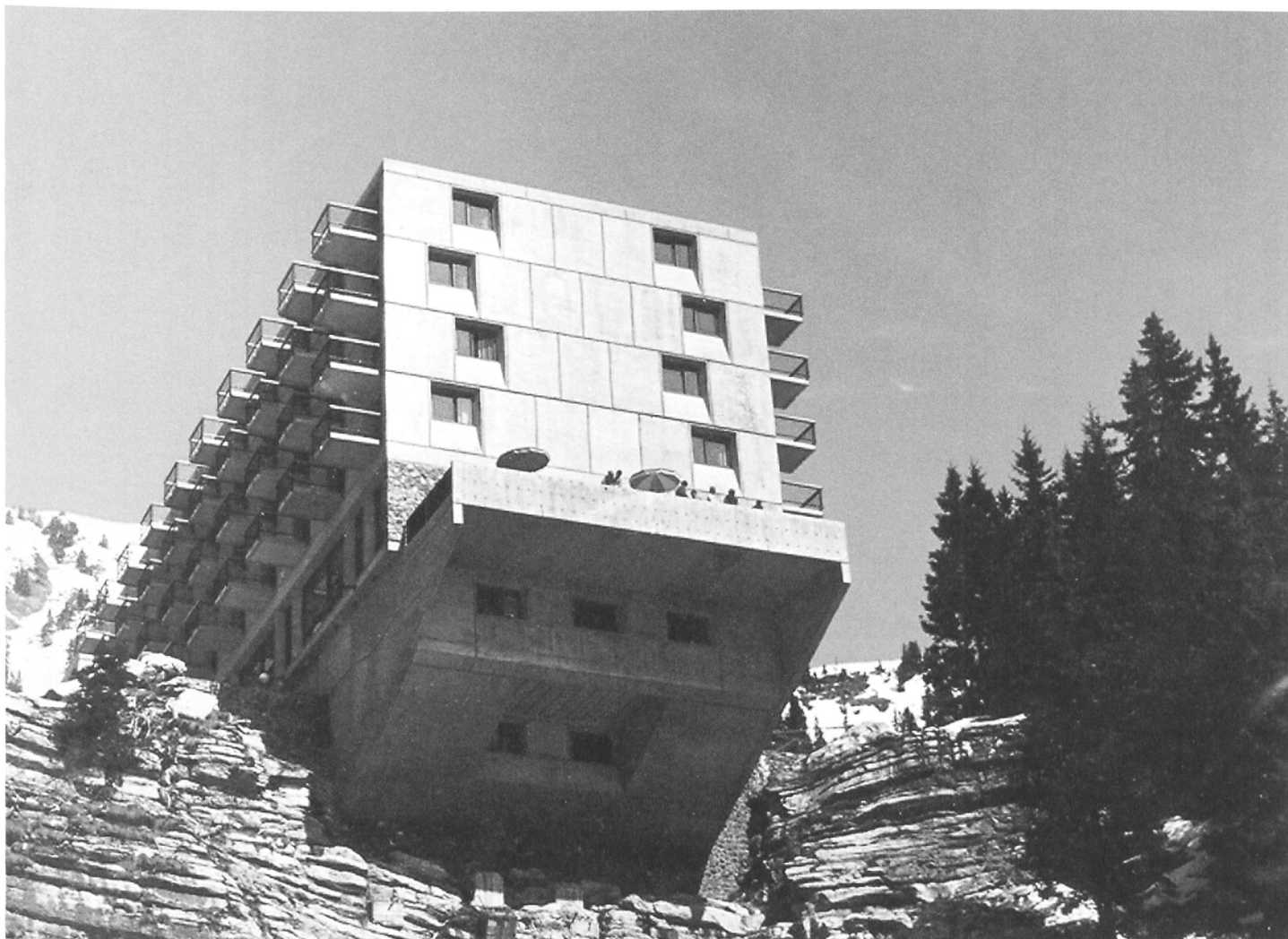
Marcel Breuer, Hotel Flaine 1967, Bild: Archives Centre Culturel de Flaine