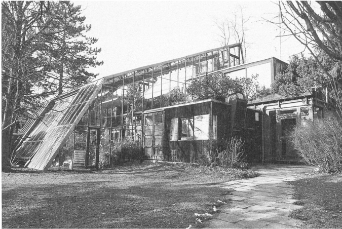
Ottos privates Wohnhaus in Warmbronn (1969) war ein Vorläufer des Passiv-Solarhauses.