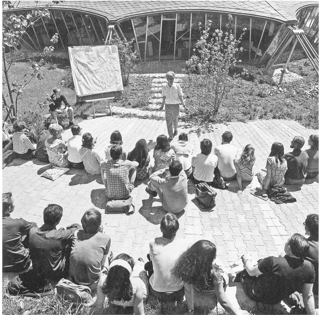
Frei Otto im Kreise seiner Studierenden am Institut für Leichte Flächentragwerke in Stuttgart; im Hintergrund das von ihm konstruierte Institutsgebäude.