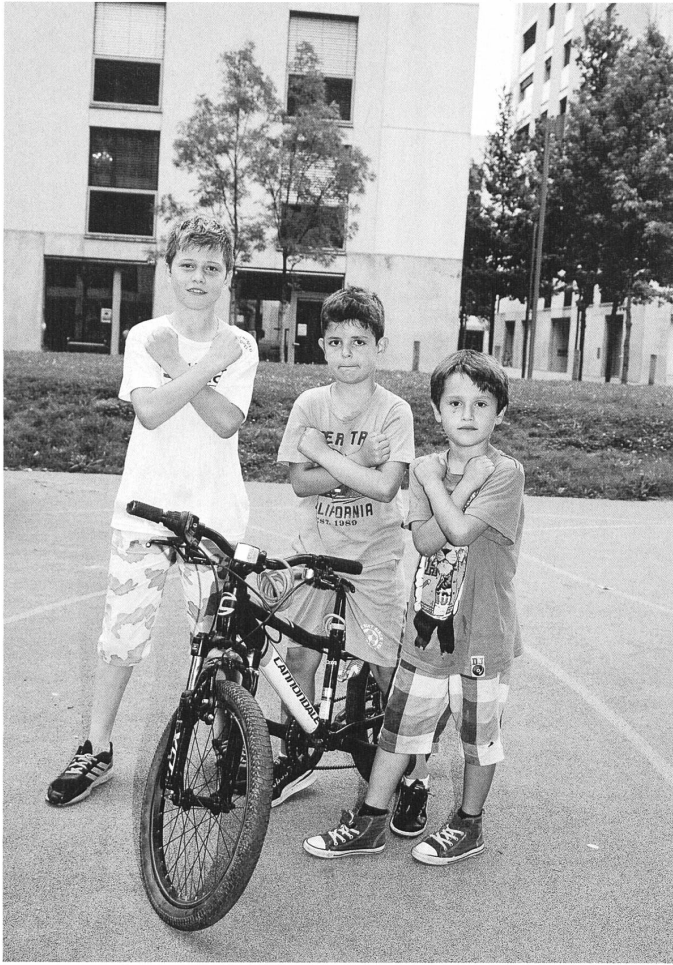
Boyz in the hood: Kinder in der Siedlung Werdwies in Zürich-Altstetten.