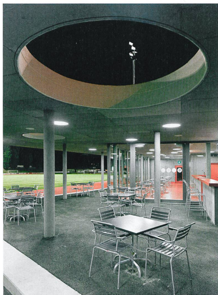
Oblichter strukturieren die Terrasse der Buvette mit Blick auf das Spielfeld.

trennt die Sportfelder von der hier ausfransenden Agglomeration ab. Der raue Beton der Mauer fällt ins Auge: Fugen sind auf den ersten Blick nicht zu erkennen, die wenigen Fenster sind aussen bündig angebracht. Zwei Merkmale, die die monolithische Wirkung des Bauwerks von der Strasse her unterstreichen.