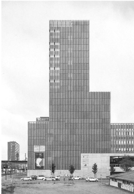
Ein kultureller Anker für Zürich-West: Der Hochschulkomplex Toni-Areal von EM2N Architekten. → S. 66 und S. 74