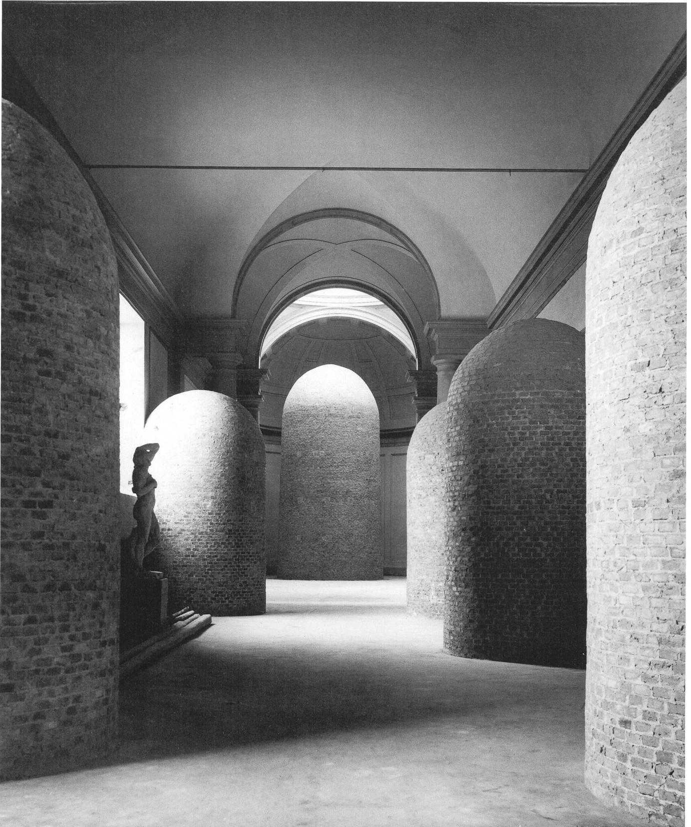
Kunstschutzmassnahmen während des Zweiten Weltkriegs in der Galleria dell'Accademia in Florenz: eingemauerte Skulpturen Michelangelos, in der Bildmitte der «David».