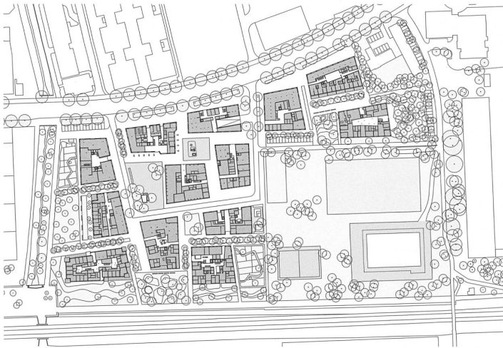
Der städtebauliche Plan des Quartiers findet im Cluster-Grundriss von Haus A ein unmittelbares Echo