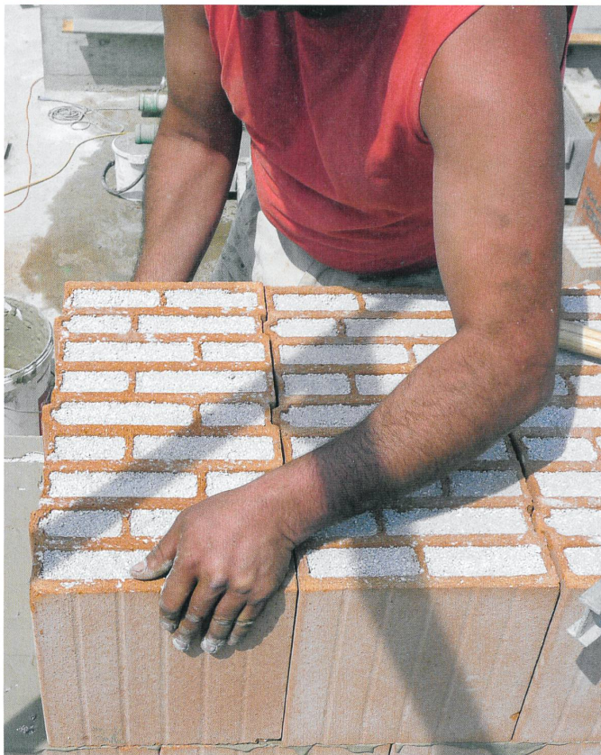
Die Baustelle lässt den Cluster-Grundriss mit Satellitenwohnungen und den versteifenden Kern in der Mitte erkennen. Quer versetztes Einsteinsmauerwerk mit Perlitfüllung