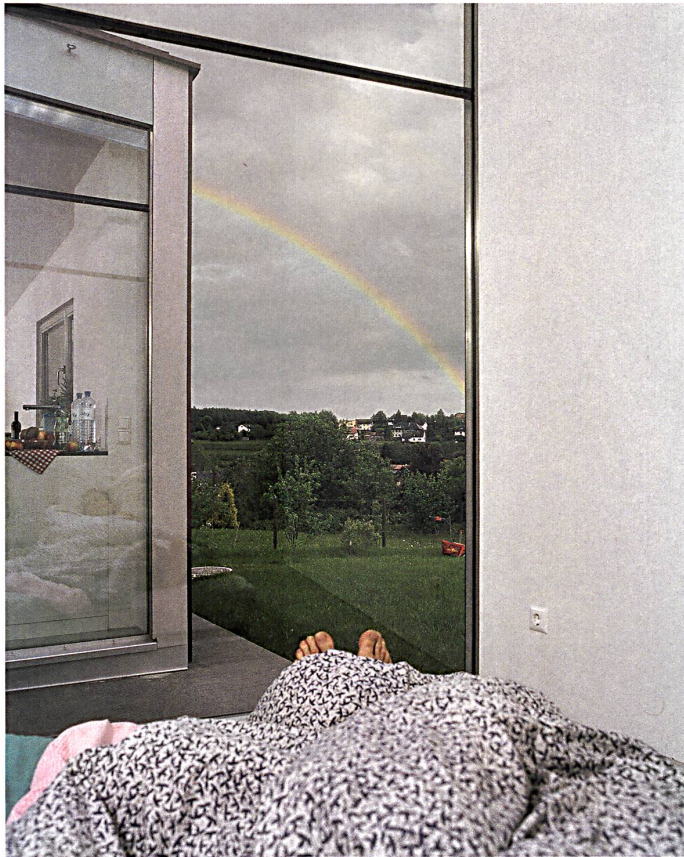
Livia Corona, 2008. Wohnhaus Pischelsdorf (A), Nominierung Architekturpreis Steiermark 2008/09, Arquitectos ZT KEG

Regelmässig erreichen unsere Redaktion Fotos, die weder das Werk noch seine Idee angemessen repräsentieren. Sie sind farblich stilisiert und beschnitten an Kontext, leer an Menschen und Menschlichem. Das soll nicht länger so sein: fünf Verbesserungsvorschläge.