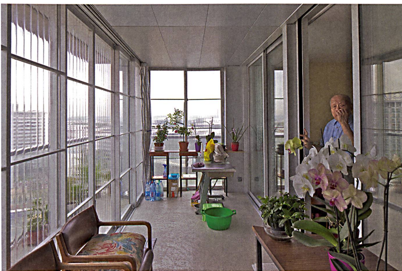
Philippe Ruault, 2012. Umbau Tour Bois le Prêtre, Paris, 2011, Druot, Lacaton & Vassal

Architektur ist aber keine autonome, sondern eine soziale Kunst. Ihr Zweck ist immer auch ein dienender, denn sie operiert in einem gesellschaftlichen Spannungsfeld. 1 Um Architektur aber beurteilen zu können, braucht es den Test ihrer Alltagstauglichkeit. Ein wirksames Kriterium dafür ist der Gebrauch. Der Gebrauch von Architektur ist der Grund, weshalb