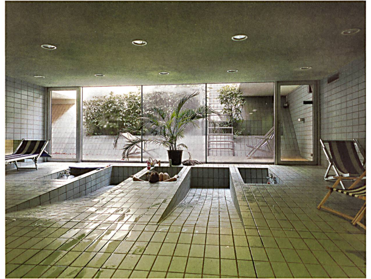
Margherita Spiluttini, 1999. Badehaus in der Wohnhausanlage Sargfabrik, Wien, 1996, BKK Architekten. © Architekturzentrum Wien, Sammlung