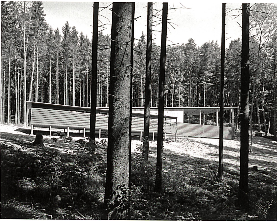
Heinrich Helfenstein, Forstwerkhöfe Turbenthal, 1994, Burkhalter Sumi Architekten gta Archiv, ETH Zürich: Vorlass Heinrich Helfenstein