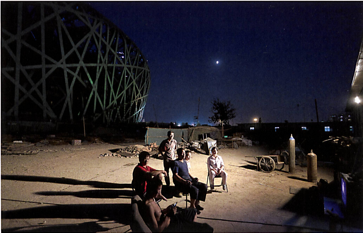
Iwan Baan, 2007. Nationalstadion Beijing, 2008, Herzog & de Meuron